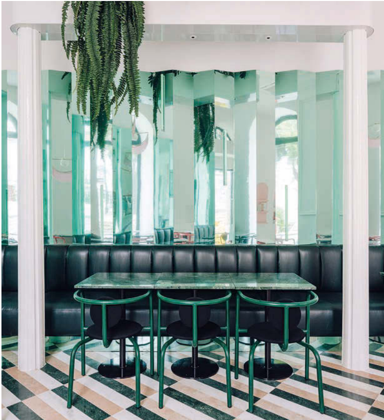
Art déco-Comeback: türkis gefärbter „Leporello-Spiegel“. • Art deco comeback: turquoise “fanfold mirror”.