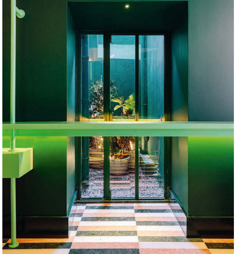
Blick auf den Lichthof, der sich hinter dem DJ-Pult befindet. • View of the atrium behind the DJ desk.