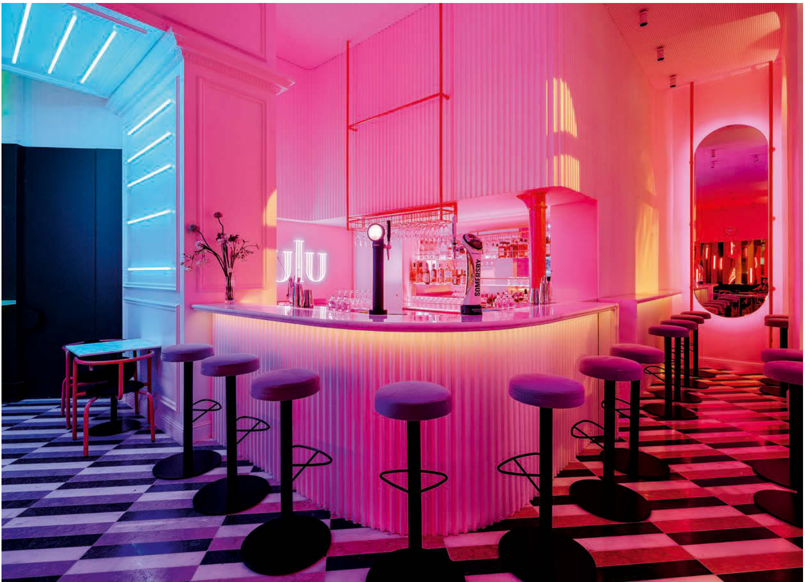
Luminöses Interieur: Joana Forjaz' Lichtdesign lässt die weiß lackierte Holzschalung im Neon-Look erleuchten. • Luminous interior: Joana Forjaz's lighting design illuminates the white wooden panelling in a neon look.