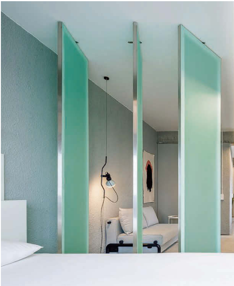
Schlaf- und Wohnbereich lassen sich durch drehbare, transluzente Panele bei Bedarf optisch abschirmen. • The bedroom and living area can be visually screened off by rotating, translucent panels if required.