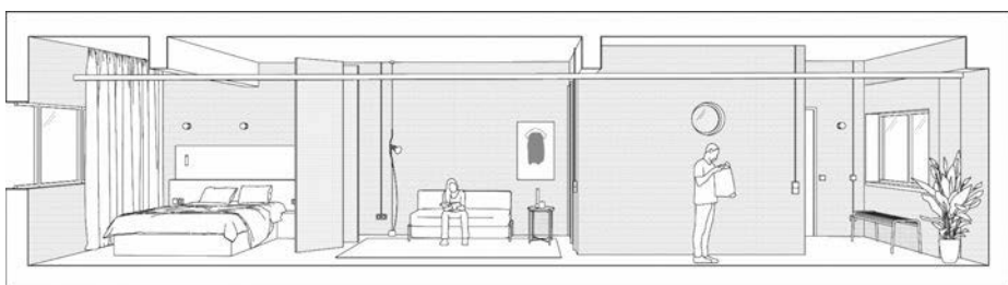
Längsschnitt • Longitudinal section